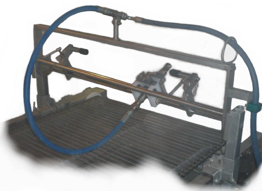
VERSION FIXE EN STANDARD (breveté West-Arc LAMA ® )